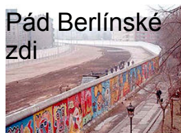
Pád Berlínské zdi