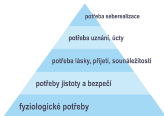
Obrázek 1 Znáznornění Maslowovy hierarchie potřeb